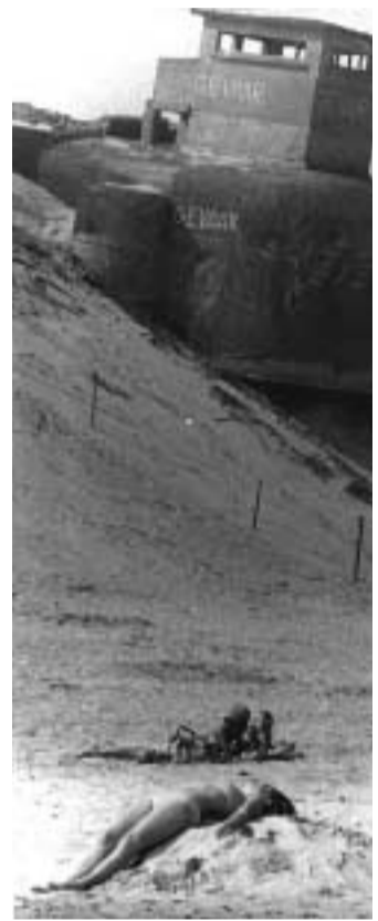
Dieses über 25 Jahre alte Foto vom Strand verdeutlicht die Probleme mit den Hinterlassenschaften des 2. Weltkrieges, hier einer der vielen Bunker des sog. Atlantikwalles.

Und volkstümlich und voller Ideen und Initiativen blieb das Partnerschaftsgeschehen über nun schon 28 Jahre.